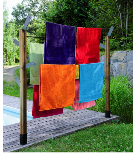
supports de fixation au sol vendus à part. floor fastenings sold separately